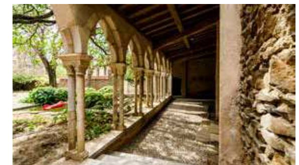
Cloître des Dominicains.